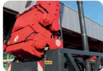
... leicht und leistungsstark!