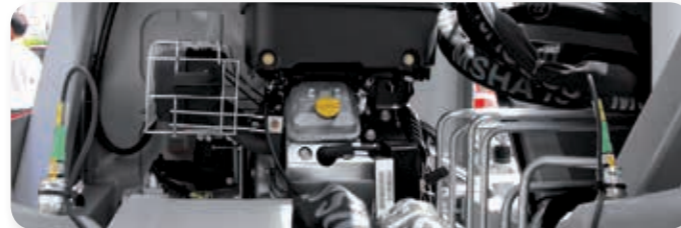
... sparsam und umweltfreundlich