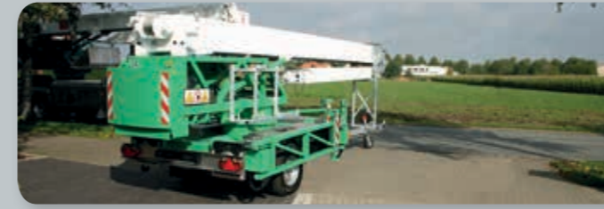
...clever und flexibel!