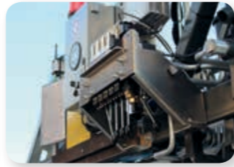
... intelligent und innovativ