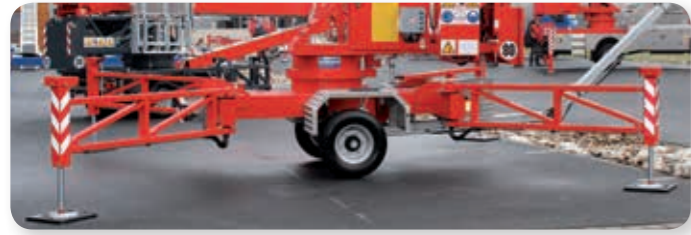
... komfortabel und sicher